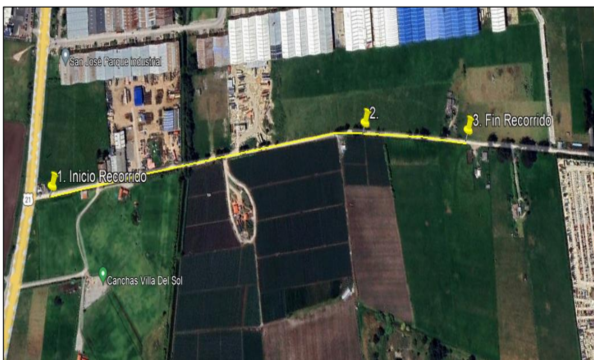
Ilustración 1. Recorrido verificación ambiental – Vereda La Isla

Se realizó recorrido de control y vigilancia de los componentes ambientales en áreas rurales del municipio de Funza, vereda La Isla el día 31 de mayo de 2024, desde las Coordenadas 4°44'27.504"N - 74°10'37.952"W hasta las coordenadas 4°44'45.23"N - 74°11'2.166"W (ver ilustración 1. Ruta amarilla), con el fin de verificar las condiciones ambientales, identificar posibles afectaciones a los recursos naturales y realizar las acciones de prevención correspondientes.